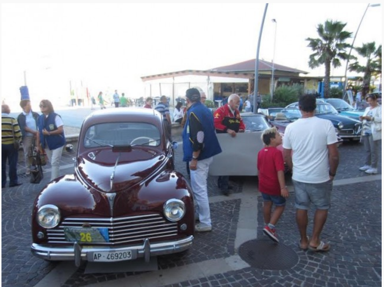
Il traguardo a Porto Recanati