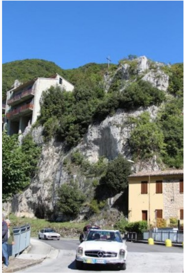
Il passaggio a Pioraco