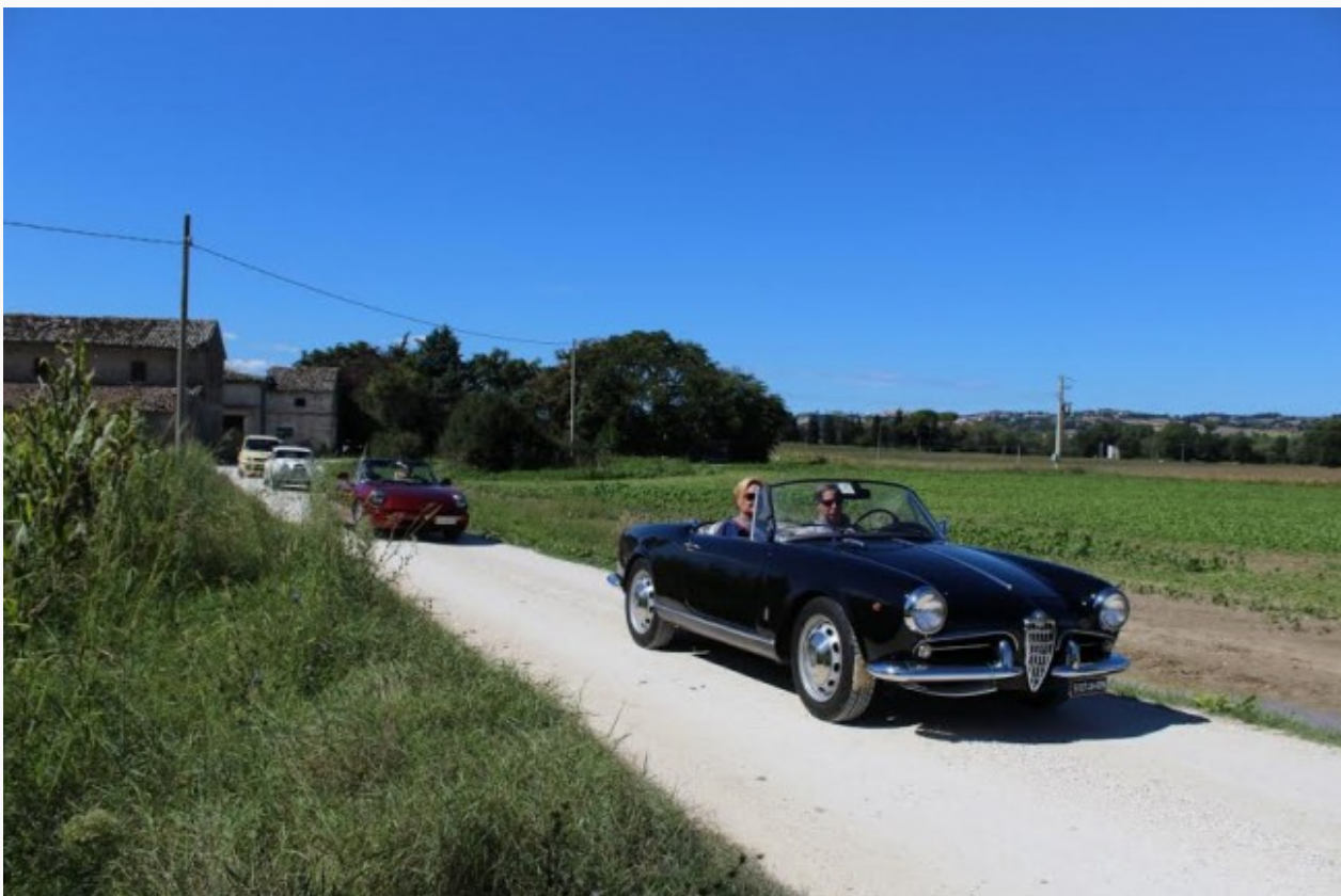
Il passaggio della carovana nella campagna maceratese (immagini della passata edizione)

Scoprire le bellezze del territorio maceratese con un giro in auto d’epoca. Seconda edizione per “Il fiume Potenza dalla sorgente alla foce”, raduno di auto immatricolate prima del 1975 organizzato dalla Scuderia Marche. Sabato 19, a partire da Sefro, bagnata dallo Scarsito, primo affluente del Potenza, una flotta di 35 auto d’epoca sfilerà lungo le rive del fiume che bagna tutta la provincia. Quindi la carovana si dirigerà a Pioraco passando per Castelraimondo per poi tornare sui propri passi e concludere la giornata a Camerino. Domenica 20 di nuovo in marcia in direzione di San Severino per poi proseguire per Treia al fine di vedere la pinacoteca e l’Accademia Georgofili. L’abbazia di San Firmano sarà l’ultima tappa prima dell’arrivo a Porto Recanati.