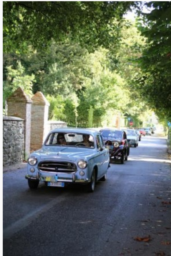
La carovana a Fiuminata