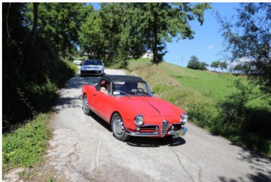
Le auto di passaggio a Seppio